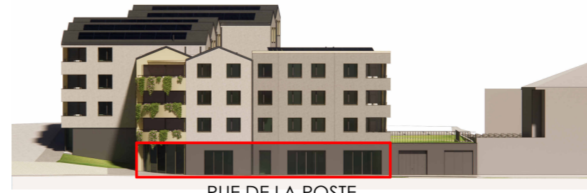
RUE DE LA POSTE